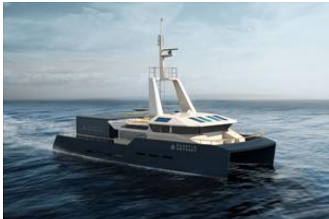
Planet Odyssey veut faire un tour du monde avec un bateau qui sera propulsé avec un carburant produit à partir de déchets plastiques.

depuis les pays en voie de développement», explique Simon Bernard, jeune officier de la marine marchande qui mène le projet Planet Odyssey, et fait le même constat que la fondation suisse.