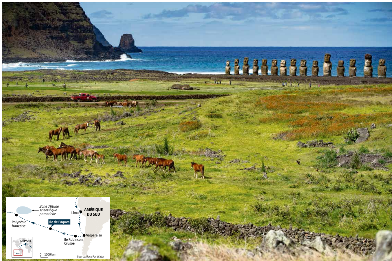
Située à quelque 3000 km des côtes chiliennes, l'île de Pâques est la plus éloignée du monde. Mais les courants y amènent chaque année quelque 50 tonnes de déchets plastiques.