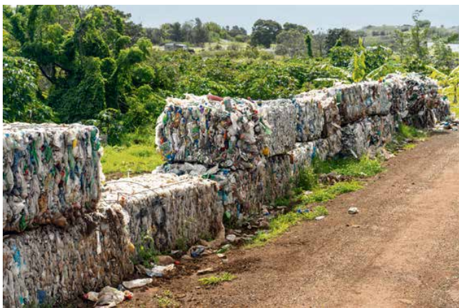
Sur l'île de Pâques, les déchets plastiques sont partout.