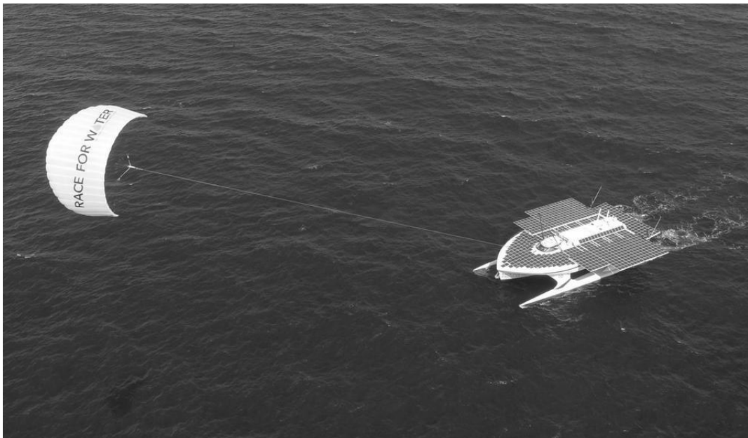
Wird von Wind, Solarzellen und Wasserstoff angetrieben: Katamaran der Organisation «Race for Water».

Etwa die Hälfte der Weltbevölkerung isst regelmässig Fisch. «Doch bei 25% der Meeresfische finden wir heute Plastik-Partikel im Magen», erklärt Marco Simeoni, Gründer der Stiftung «Race for Water», die sich dem Schutz der Meere widmet.